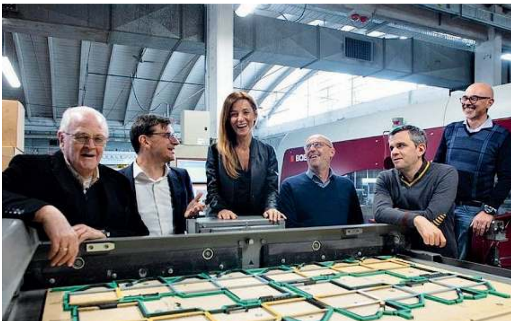
Al vertice. Il Consiglio di amministrazione della Imbal Carton

I progetti. Ma non è tutto. Le cose potrebbero andare anche meglio nel 2021, complici importanti investimenti. Imbal Carton, infatti, ha già preventivato 4,5 milioni di investimenti nel sito cremonese di Drizzona, dove verrà installata una nuova linea produttiva (la prima in Italia) per scatole all'americana che originerà, nei piani dei Lancellotti, un incremento dei volumi di circa il 25% e l'assunzione di una mezza dozzina di nuovi dipendenti (oggi sono 112, e a fine anno riceveranno un premio di mille euro ciascuno per il raggiungimento degli obiettivi sanciti dalla contrattazione di II livello).