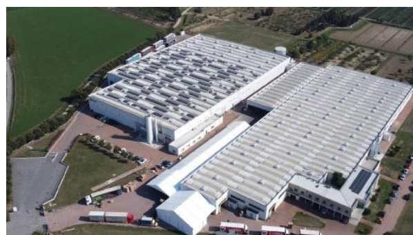
Imbal Carton punta anche sugli impianti fotovoltaici a supporto dei siti di Piacenza Drizzona (foto) e Prevalle